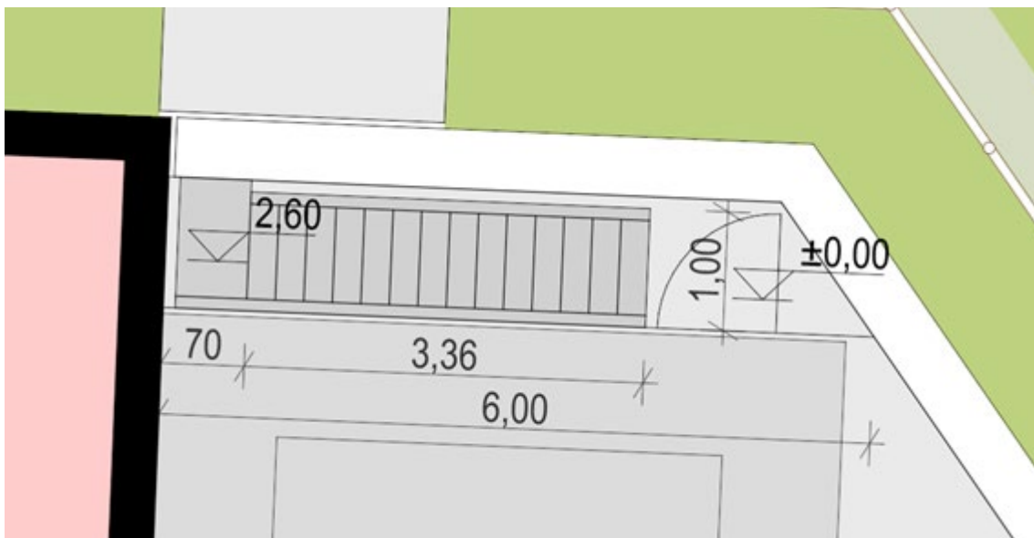
Prikaz postavk II.1, II.3, II.4