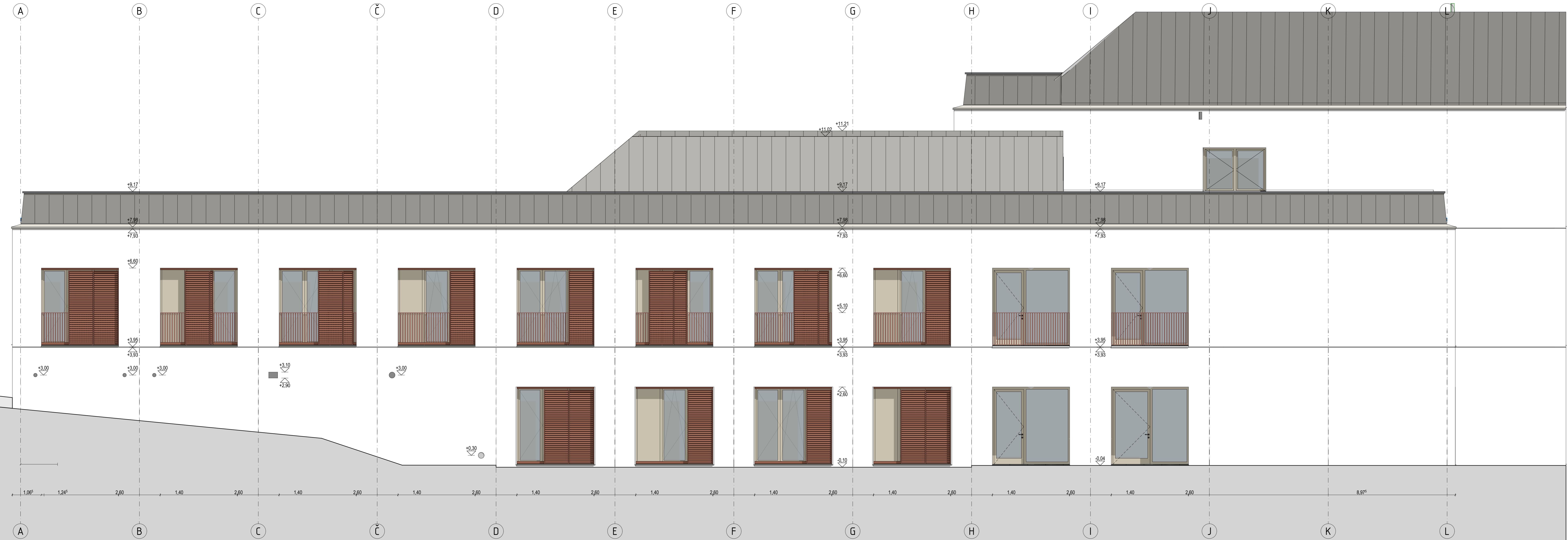
Zahodna fasada (IZ)

OPOMBE: * Vse mere je potrebno preveriti na mestu vgradnje. * Izdelavo poruze in izvedbo projekta je potrebno izdelati skladno z načrtom. Načrti je potrebno upoštevati v celoti (risbe, opisi in popisi). V priloženih listarskih napak in morebitnih neskladjih v projektu, je poruznik ali izvajalec dolžan na to opozoriti odgovornega projektanta arhitekta. * Poruznik ali izvajalec je dolžan opozoriti na morebitno skrajno pomanjkljivo izvedbo del, opozoriti ali popraviti. Predloge popravila odgovorni projektant. * V sklopu izvajalčeve poruze sodijo vsi delavni načrti, ki jih pred izvedbo glade tehnične pravilnosti, zahtevane kakor koli in izgleda poruzi odgovorni projektant. * Kjer ni opredeljenega izvedbenega inštalacijskega dela ali izdelka, ga mora izvajalec pred izvedbo predložiti, izbor poruzila odgovorni projektant in investitor. * Vzorce vseh finišnih materialov in poruznik dolžan predložiti projektantu v poruzilo. Kjer so možne alternative v izbiri materiala (batalne obloge površin, njihove odtenke, vrste in mešanje prahov, podkonstrukcije, vzorci poslikov, okovje, dobave stavbnega pohištva in podobno), je pred izvedbo obvezno predložiti vzorce, ki jih poruzila odgovorni projektant arhitekta in investitor.